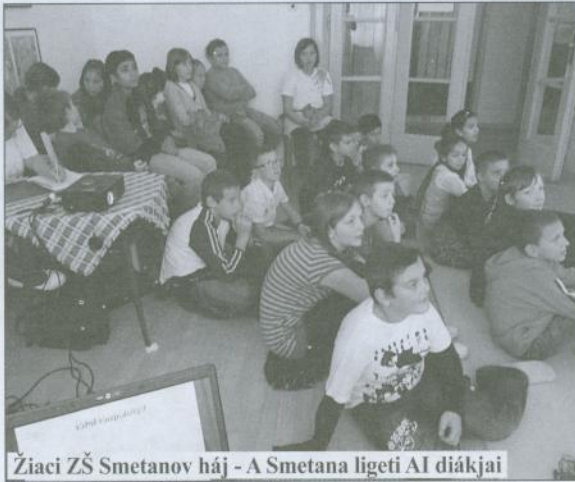
Žiaci ZŠ Smetanov háj - A Smetana ligeti AI diákjai